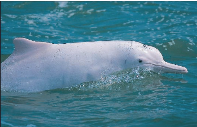
SAMUEL HUNG, HONG KONG DOLPHIN CONSERVATION SOCIETY

Una embarcación grande que lleva muchos pasajeros es menos molesta que varias embarcaciones con pocos pasajeros.