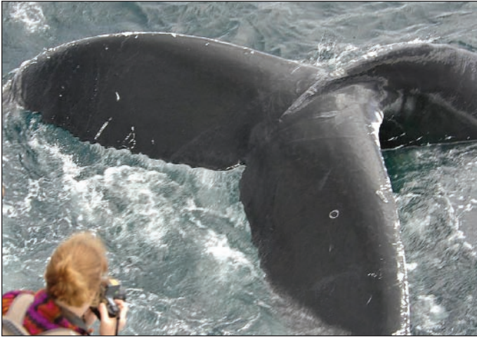
DEB YOUNG, CORTESIA DE O'BRIEN'S WHALE AND BIRD TOURS